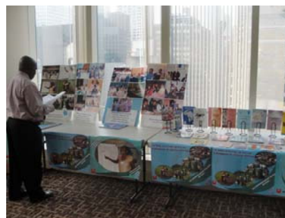
Photo de l'exposition des outils

Une exposition de photos et des outils (affiches, manuels de formation, outils de plaidoyer ; rapports, etc) produits dans le cadre des différents projets a permis aux participants au panel de mieux apprécier le travail du WILDAF-AO. Certains de ces outils ont été distribués.