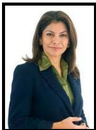
Laura Chinchilla, première femme Présidente du Costa Rica

Laura Chinchilla, 50 ans, est devenue le 7 février 2010 la première femme présidente du Costa Rica , un pays qui a inscrit l'écologie, l'éducation, la santé et le rôle des femmes au cœur de ses politiques publiques.