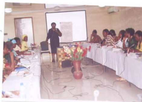
La facilitatrice faisant sa présentation

Les représentants des réseaux nationaux du WILDAF pour l'Afrique de l'Ouest notamment le Bénin, le Burkina, la Côte d'Ivoire, le Ghana, la Guinée, le Mali, le Nigéria, le Sénégal et le Togo se sont retrouvés du 08 au 10 février 2010 à Lomé en atelier de planification quinquennal (2010-2014).