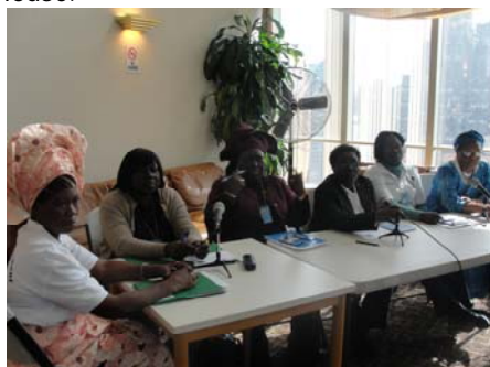
Photo du panel

La participation du WILDAF-Afrique de l'Ouest à la 54 ème session de la Commission des Nations Unies sur le Statut de la Femme tenue du 1 er au 12 mars à New York a été marquée par la tenue de deux événements parallèles. En corrélation avec la session officielle consacrée à l'évaluation de la Plateforme d'Action de Beijing, le premier événement était un panel qui avait eu lieu le 05 mars au Nigeria House.